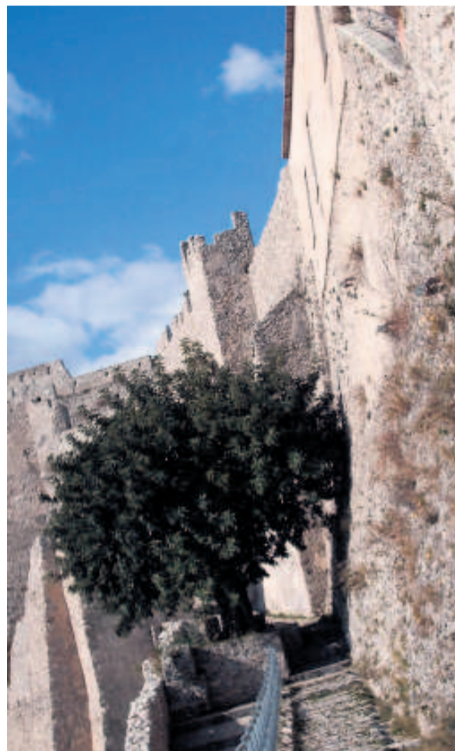
Uno scorcio dello spettacolare castello medievale di Arechi

La città è raggiungibile in molti modi ma un modo originale di arrivare a Salerno è prendere il metrò del mare da Napoli o da Capri (funziona tra giugno e