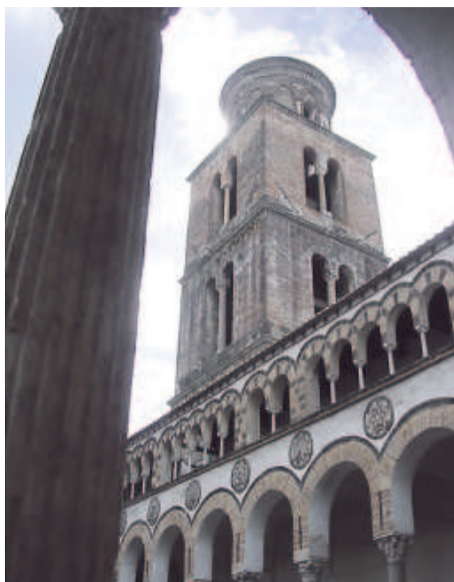
Il campanile del Duomo di Salerno visto dal chiostro antico

Passeggiare nel centro di Salerno è una scoperta continua. Nei caffè e nelle pasticcerie si possono gustare dolci deliziosi, mentre trattorie e ristoranti offrono menù di terra e di mare anche a prezzi contenuti e sempre di ottima qualità. Una miriade di negozi offre merci di ogni tipo, ma se si vuole portare a casa un souvenir davve-