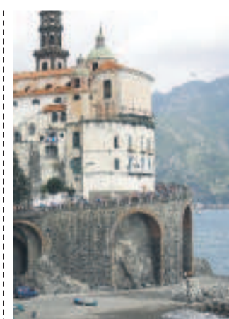
Il suggestivo borgo di Ravello

settembre) attraccando fino ad Acigliano, Palinuro o Sapri.