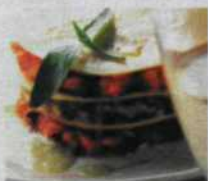
Sopra, un piatto di lasagne rivisitate da Guy Martin. A destra, un vivace angolo di Parigi.

Ma il vero appassionato non si limita al peccato di gola. Così vale la pena frequentare i corsi di accademie di cucina come l' Atelier des chefs ( www.atelierdeschefs.com ) e tornare a casa con nozioni fondamentali sulla scelta degli ingredienti, la preparazione dei piatti e il loro abbinamento con i vini.