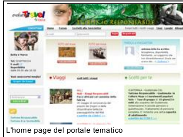
L'home page del portale tematico

Evolution Travel dedica un portale al turismo responsabile. Le proposte di viaggio e soggiorno messe a punto dall'operatore di Montegrotto Terme in Italia e all'estero sono definite a basso impatto ambientale e ad alto