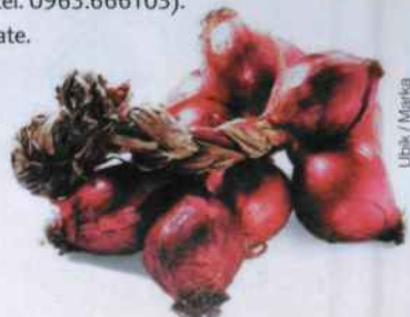
Ubik / Marka

Giugno è il mese di raccolta della rinomata cipolla rossa di Tropea (Vibo Valentia), resa particolarmente dolce dalla natura dei terreni soffici e profondi di coltivazione. È il momento migliore per assaggiare il piatto tipico che da qui si è diffuso in tutta la Regione, la cipollata, preparato con uova sbattute in un soffritto di erba cipollina freschissima. Una tradizione risalente al tempo dei latifondi, quando i mezzadri dovevano consegnare i bulbi ai proprietari terrieri ma potevano trattenere le erbe di scarto, con cui si inventarono questa saporita ricetta che si può assaggiare al ristorante Pimm's a Tropea (tel. 0963.666105). Le cipolle rosse crude sono utilizzate soprattutto nelle insalate. Per acquistarle rivolgetevi a Delizie Vaticane, a Tropea (tel. 0963.669523), che le propone anche in una squisita confettura da spalmare sul pane. Ed esiste l'Accademia di Tutela della Cipolla Rossa (tel. 0963.669523).