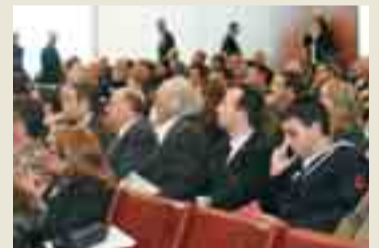
A pag. 6

Forum 'Andare oltre la crisi' è il leit motiv dei convegni di TTG Incontri e TTI del 2009. Internazionalità, etica, strumenti e risorse i temi trattati.