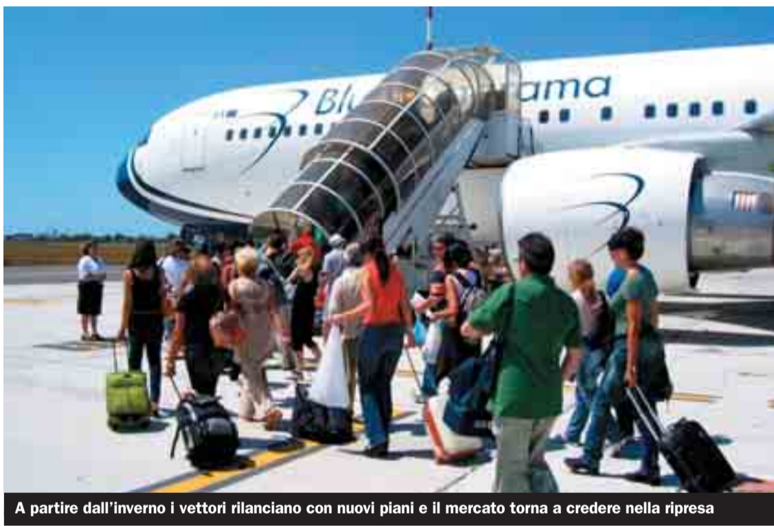
A partire dall'inverno i vettori rilanciano con nuovi piani e il mercato torna a credere nella ripresa

I vettori tornano a investire dopo una stagione di consolidamento