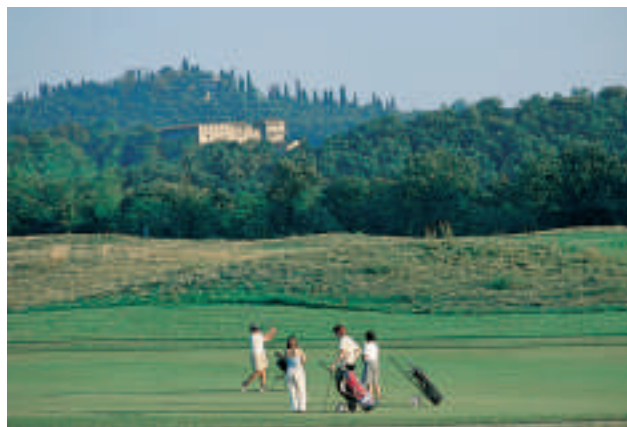
Il Golf Palazzo Arzaga ospiterà gli Open seniors 2008.

Non mancano in zona né i grandi alberghi né i circoli di livello: l'Alpin royal in Val Aurina ( www.alpinroyal.com ) è un ►