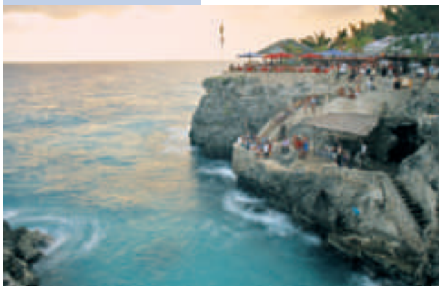
In Giamaica si possono trovare ottime spiagge e campi da golf.

A Negril, sull'estrema punta occidentale della Giamaica, il Couples swept away (foto sopra) è un 5 stelle superior sulla nota spiaggia di Long Bay. Tra i servizi dell'all inclusive, anche un 18 buche di oltre 6.300 yard con green fees illimitati (7 notti da 1.642 euro in novembre, volo incluso Evolution Travel, www.volivacanzeviaggi.com ). Il Gran Tour Golf della Malesia, invece, prevede 14 notti in 5 stelle tra Kuala Lumpur e Malacca e dieci percorsi diversi in altrettanti Golf&country club in giro per l'arcipelago da 2.480 euro tutto compreso, fino al 31 marzo 2009 ( www.loftviaggi.com ).