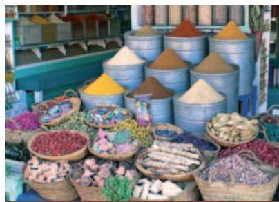
Spezie in vendita nella Medina