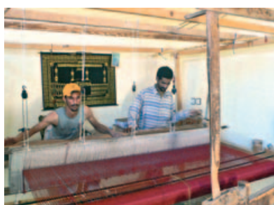
Tessitori di tappeti al lavoro