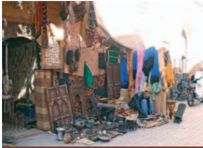
Negozzi nella città vecchia